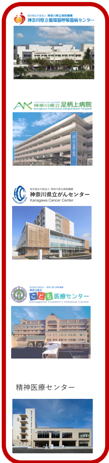
神奈川県立病院機構