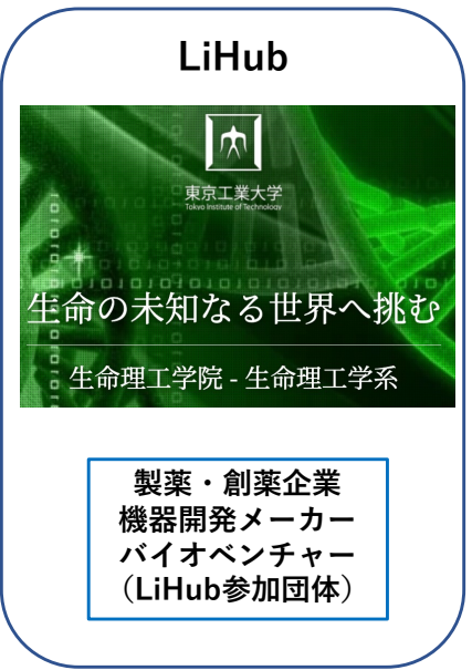
東京工業大学生命理工学院